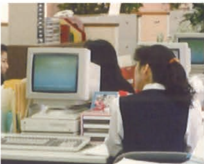
入社当時のデスク

ことをいい、リースを継続または終了するかの対応をすることが主な業務です。お客さまからまだご連絡がない場合に、丁寧に説明し、ご継続のお返事をもらえたときは、またそのお客さまとつながりを続けることができ、とても嬉しいです。 満了業務では、お客さまとお電話でやり取りすることがほとんどです。だからこそ、言葉遣いや話し方がとても重要だと痛感しています。失敗した時のフォロワーも重要だと思っ