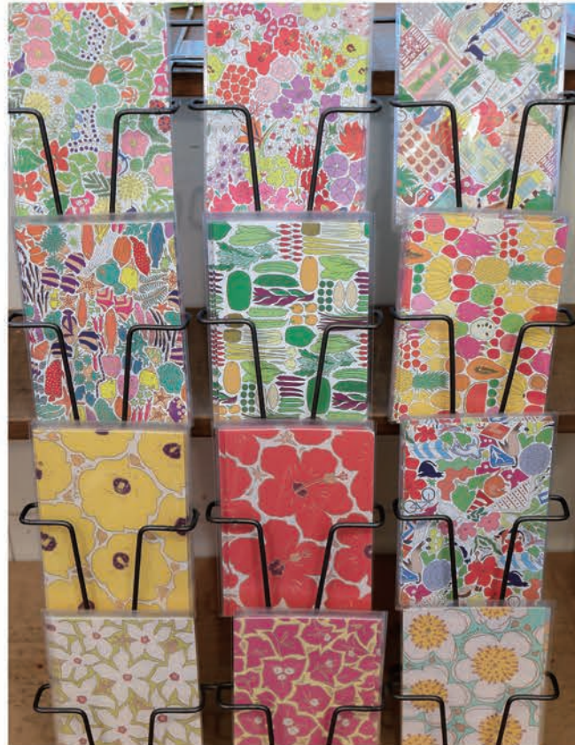
ポストカード 沖縄の身近な素材をモチーフにしたテキスタイル。実物に近い色合いを大切にしている作品はどれも鮮やかで、南国・沖縄の自然が持つパワーを感じられます。「それぞれのパーツの組み合わせがカッチとはまった時がとても気持ち良い」と話してくれました。

MIMURI(ミムリ) 那覇市松尾2-7-8 ☎050-1122-4516 https://www.mimuri.com/