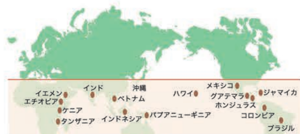
COFFEE BELT ＜資料提供＞一般社団法人 沖縄コーヒー協会

コーヒー専門店も多く、「ジャパンコーヒーロースティングチャンピオンシップ」や「ワールドコーヒーロースティングチャンピオンシップ」で、優勝・準優勝に輝いたコーヒー焙煎士もいて、沖縄のコーヒー熱は年々高まっています。世界に認められた素晴らしい技術を持つ焙煎士や生産者の手によって、世界に誇れるスペシャルティコーヒーが生み出される日は近いかもしれません。