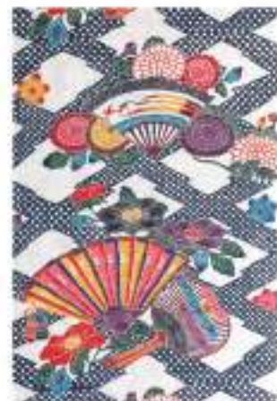
紅型タペストリー(季花扇尽し)