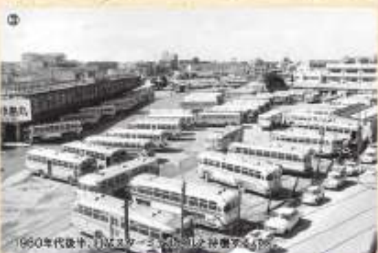
1980年代後半、旧バスターミナルの風景。

いたバスの営業所と路線別のホームが集合した那覇バスターミナルが完成。その後、1978年の7・30交通方法変更を機に全面改裝され、2015年の新バスターミナル建設にともなう一時閉鎖までの37年間、稼働した。1982年の記録によると、路線バス会社が4社が利用、乗降場17カ所、1日の発着回数が3620回