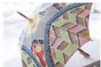
紅型日傘(イジュの森)