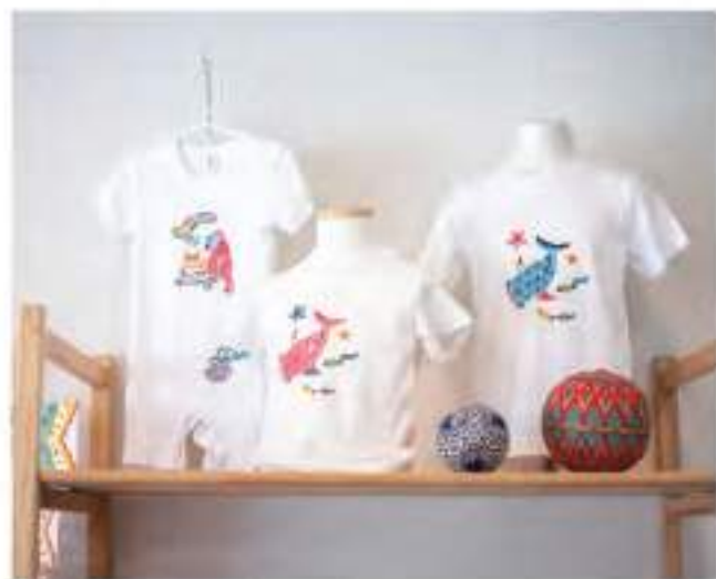
紅型ベビーロンパース、紅型キッズTシャツ