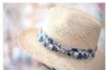
紅型ハット(くぼ福)