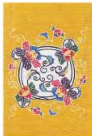
紅型タペストリー(牡丹唐草)