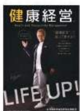
※「健康経営」は、NPO法人健康経営研究会の登録用語です。

それでは、「健康経営」を始めるためには、どんなことに取り組んだほうがいいのか。最初の一步は、経営者自身が協力してくれそうな社員に声をかけること。経営者が本意を示し、一緒に参加することから始めてください。賛同する社員は全社員ではなく少数からOK! まずは、職場の健康課題について取り組み