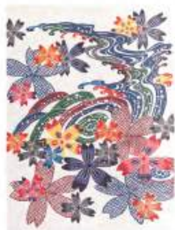
紅型タペストリー(桜に流水文)