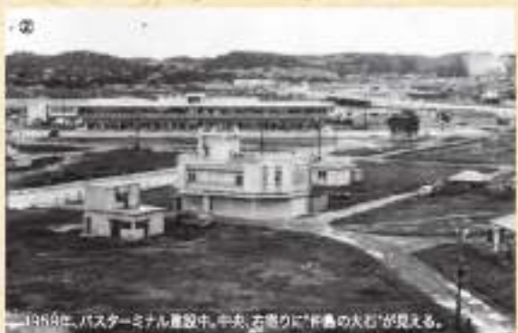
1986年、バスターミナル建設中。中央、右側に「新島の犬石」が見える。

ド観光客の利便性も考えたデジタル多言語案内システムで運行情報を案内するなど、沖縄の公共交通機関としてサードもさらに充実した。 その新バスターミナルが建つ地の歴史をさかのぼってみると、交通の要所としての物語は古い。大正3年には沖縄県鉄道「軽便鉄道」の起点だった那覇駅がこの地に在り、その遺構がバスターミナル工事中の2015年と2016年に新たに目撃された。県内マスコミで紹介されたので記憶している人も多いと思う。 1959年、軽便鉄道の那覇駅跡地に、那覇市内に点在して