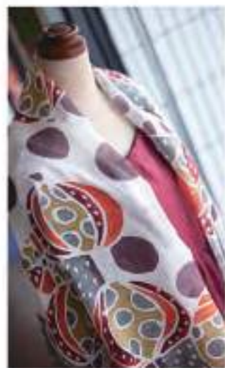
紅型ストール(月桃)