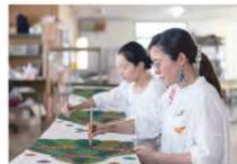
ショップの2階にある工房で、姉妹一緒に制作しています。紅型染め体験もあります。