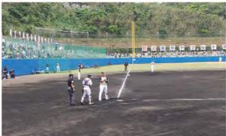
昨年のキャンプ風景

県内シンクタンクの調査レポートでは、昨年のプロ野球春季キャンプの経済効果は、過去最高の122億8800万円と言われています。県外からの観客が増えたことによる宿泊や飲食、土産・グッズの売上増などが主な要因だとか。先述した県内在のスポーツチーム