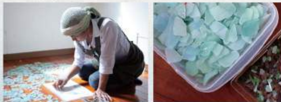
ビーチなどで拾ったシーグラスを一つ一つ手作業で配置しています。