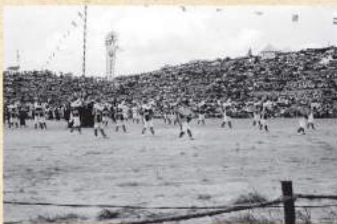
第7回コザ市・エイサーコンクール

今年で63回目を迎える「沖縄全島エイサーまつり」。3日間、県内外から約30万人の観客を動員するという、県内きっての大型イベントだ。 そのはじまりは、1956年にコザ小学校で開催されたコザ市・エイサーコンクールである。戦