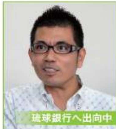
琉球銀行へ出向中