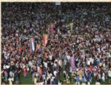
第62回沖縄全島エイサーまつり最終日カチャーシー

とゲート通りを通行止めにして沖縄市の青年会を中心としたエイサーが練り歩く。中日と最終日は沖縄市コザ運動公園で行われ、中日は沖縄市各地域の青年会のエイサーが楽しめる沖縄市青年まつりが行われ、最終日は県内各地から推薦を受けて選ばれたエイサーが登場する。 今年3月に開催したエイサー会館では、その沖縄全島エイサーまつりの動画を見ることができるといふ。 ところで、「沖縄全島エイサーまつり」で第1回から変わっていないものがある。旧盆の翌週末