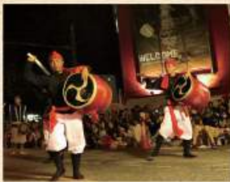
初日の道ジュネー

市民を元気にしたい!という思いからはじまった 沖縄の夏の風物詩「沖縄全島エイサーまつり」 後、コザ市がオフリミッツ(米国人・軍属・家族が民間地域へ出入りするのを禁ずる規制)によって受けた経済的ダメージが市民の気持ちを暗くしていたことに危機を感じ、同市で盛んだったエイサーで元気を取り戻そうと企画された。 記念すべき第1回のエイサーコンクールに参加した青年会は9団体で、約3万人の観客が詰め掛け、会場は熱気に包まれたという。しかし、地域によって型が違うなど、一定の審査基準で順位をつけるのには無理があるということになり、コンクールは22年目から「まつり」として形を変え、今に至る。 現在では、3日間のまつり初日に道ジュネーとして沖縄ミュージックタウン側の国道330号