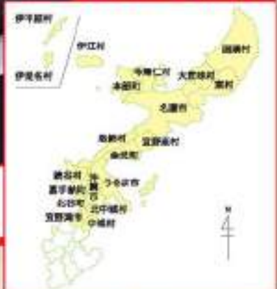
営業第三部 担当エリア

熱中し過ぎて溶けないよう、よんなーよんなー気をつけながら、皆様の元に届けつけますので、ゆたさるぐとぅうにげーさびら。