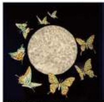
満月に舞うハーバール