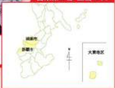
営業第二部 担当エリア

いつでも心に、「笑顔」と「ガッツ」を忘れずに！爽やかな笑顔を携えて営業に向いたいと思いますので、温かく迎えてください。(笑)