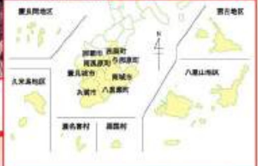
営業第一部 担当エリア

今年の夏も、一致団結し目標を達成しよう。その時には、きっとうまいビールと肉が、まっている。BBQで最高の笑顔を自慢りするぞ！！